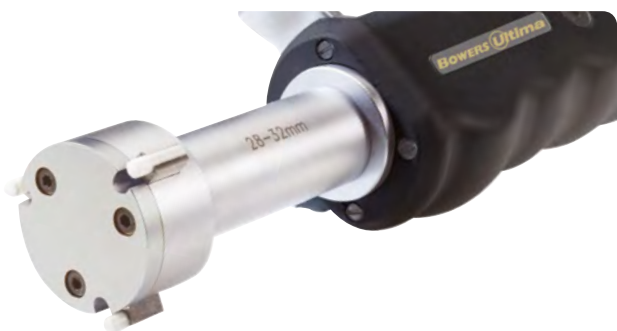
Cabeza ULH19 de 28-32mm