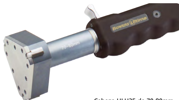
Cabeza ULH25 de 70-80mm